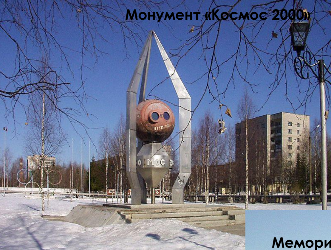
Монумент «Космос 2000»