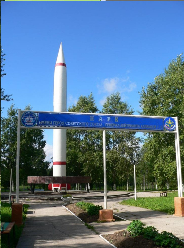
Парк. Баллистическая ракета