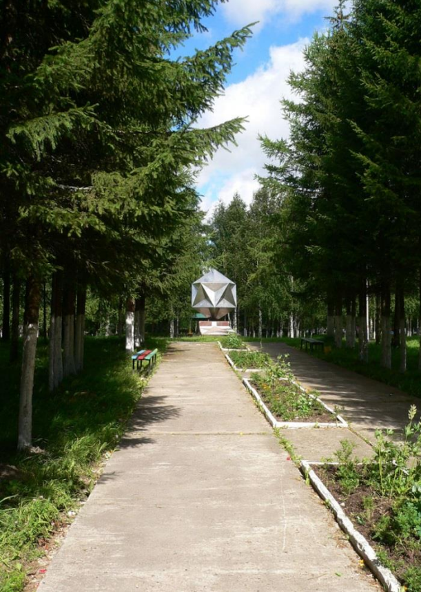
Стела испытателям ракетной и космической техники