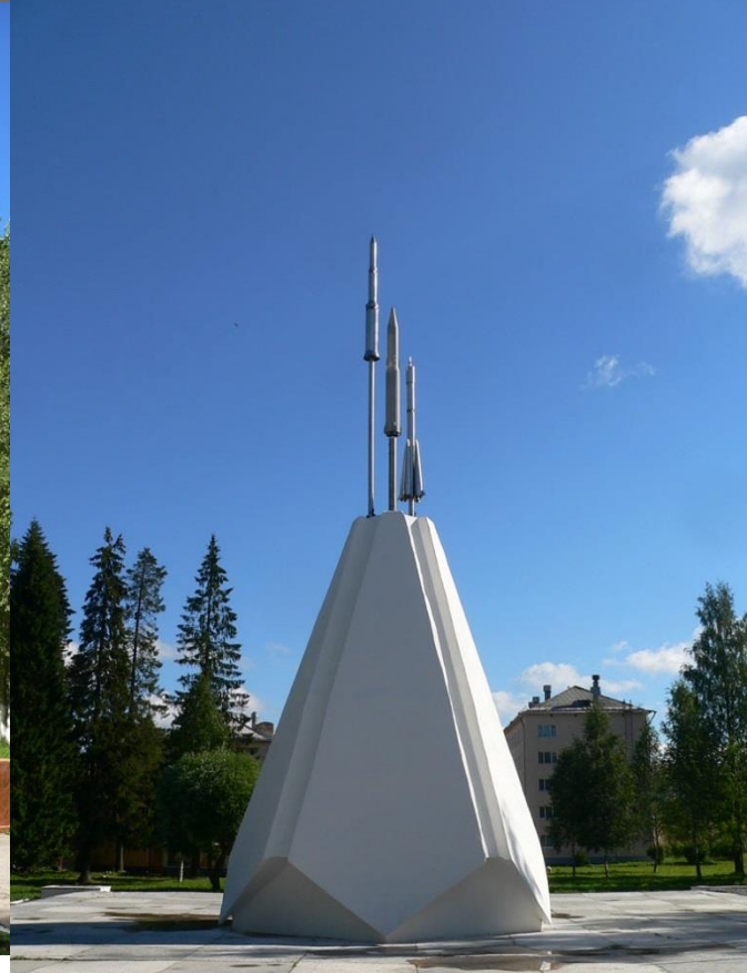
Памятник основателям гарнизона